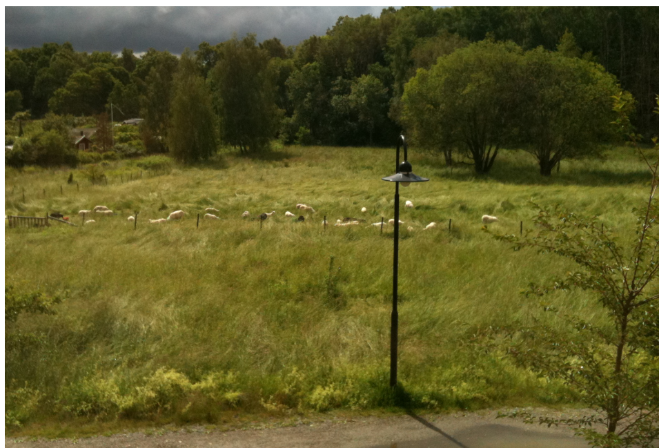
Figur 3: Fotot är taget mot fårhagen och rakt söderut från balkongerna i Brf Brunnsviken.

Styrelse vill särskilt påpeka att området ursprungligen inte är en våtmark. När föreningen bildades för 30 år sedan var området en äng. Enligt 4 kap. Miljöbalken: "Inom en nationalstadspark får ny bebyggelse och nya anläggningar komma till stånd och andra åtgärder vidtas endast om det kan ske utan intrång i parklandskap eller naturmiljö och utan att det historiska landskapets natur- och kulturvärden i övrigt skadas." Här planeras nu ett mycket stort ingrepp i och en total omvandling av det historiska landskapet. All formulering som "att återställa våtmark" är således felaktig.