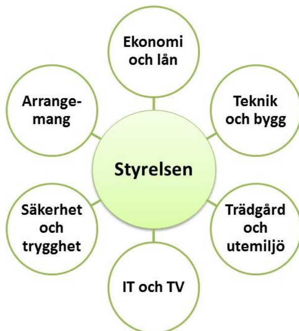
Figur 1: De sex ständiga arbetsgrupperna som stödjer styrelsen.

Föreningen organiserar sin verksamhet i sex ständiga arbetsgrupper och ett antal tillfälliga projektgrupper som stöd åt styrelsen i såväl direkt genomförande som i utarbetande av beslutsunderlag inom respektive ämne.