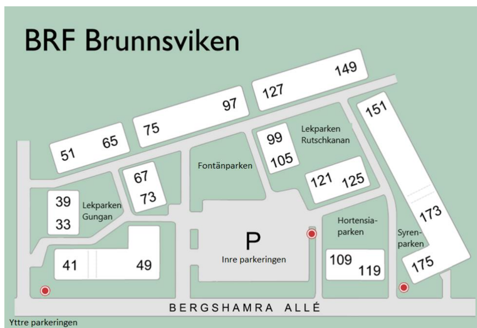
Figur 3: Nya namn på föreningens gemensamma ytor och lekparker.