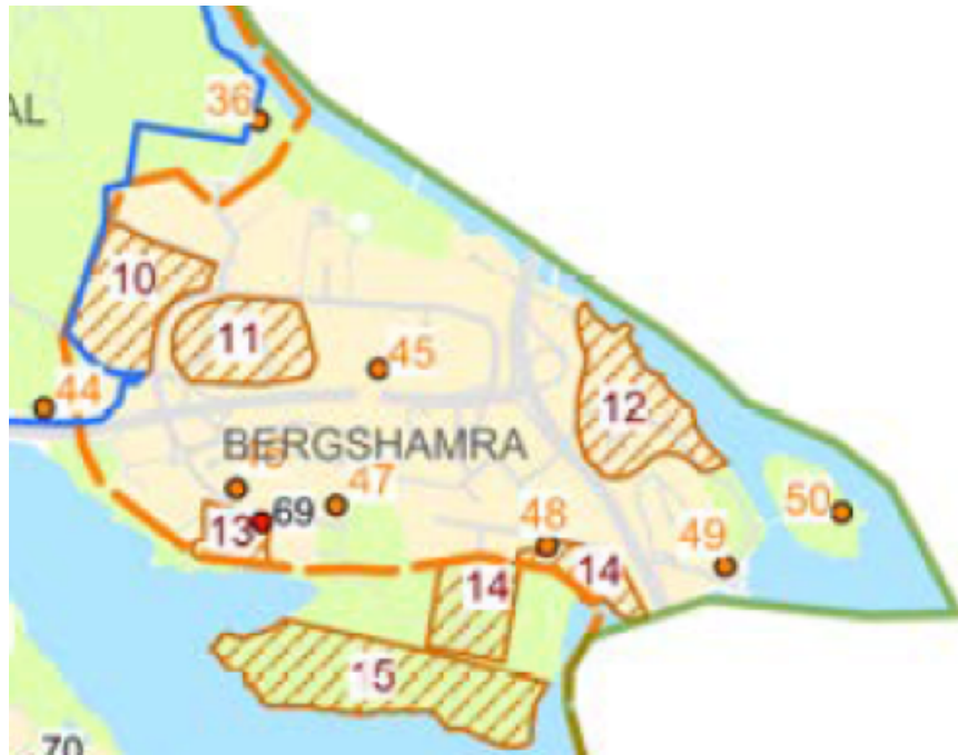
Figur 3: Karta över Bergshamra i Solna där vissa markerade områden beskrivs som kulturhistoriskt värdefulla.

I södra Bergshamra finns tre områden som definieras som kulturhistoriskt värdefulla miljöer.