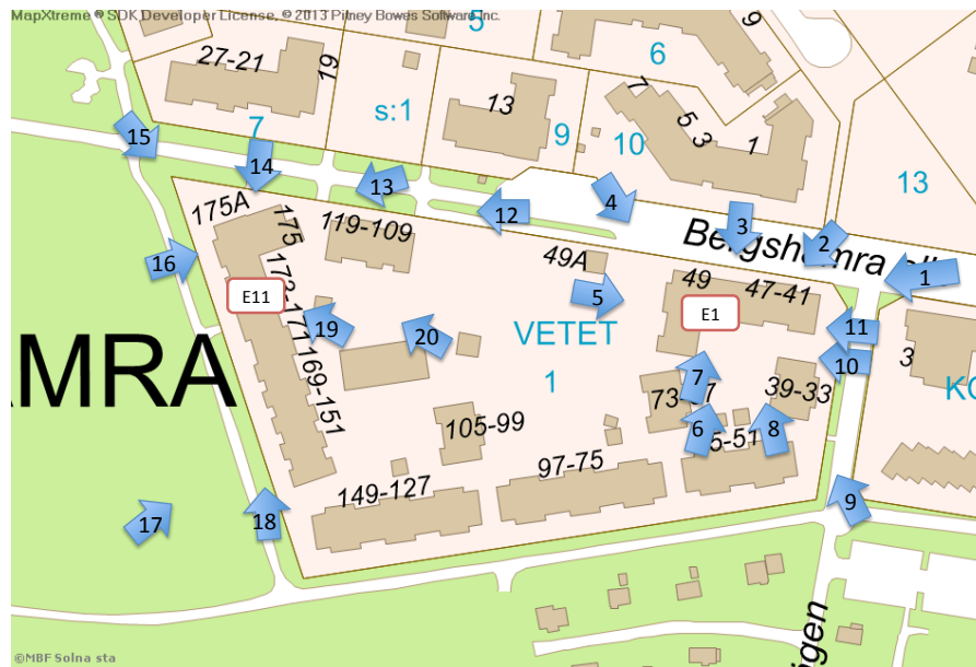
Figur 2: BRF Brunnsviken olika byggnader är placerade så att kringbyggda gårdar bildas. De blå pilarna med siffror markerar platser och riktningar från vilka 20 fotografier är tagna på hus E1 och E11 där paneler ska installeras. Kartan är tidigare bifogad ansökan till byggnadsnämnden.

I fallet byggnad E1 vetter takfallen som ska förses med solpaneler mot just en kringbyggd gård.